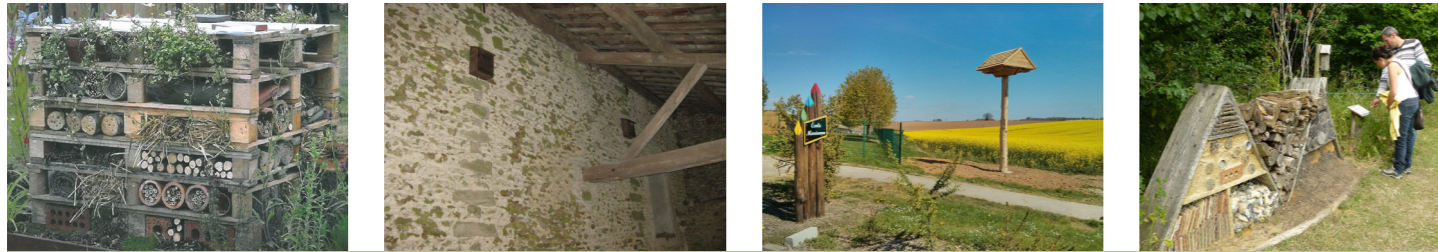
Hôtel à insectes, nichoir à passereaux, hôtel à hirondelles, etc.