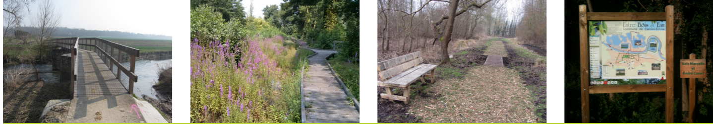
Passerelle, platelage en zone humide, barrière, banc, panneau thématique, etc.