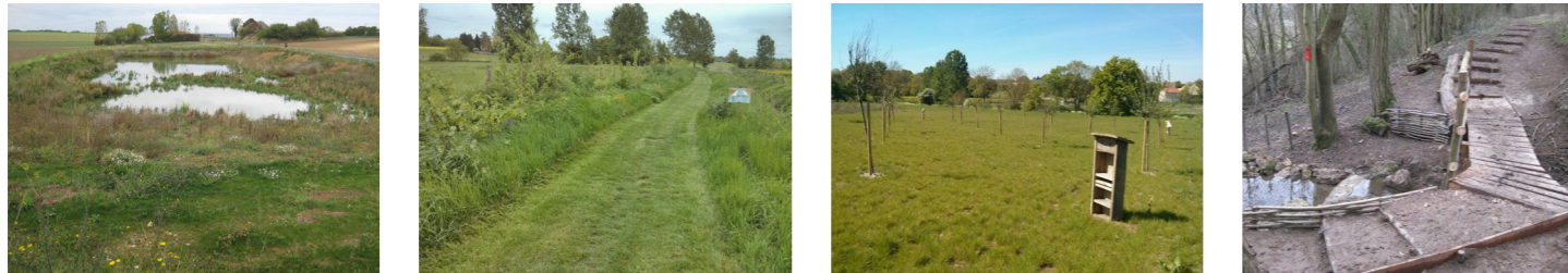
Restauration de mare ou de fossé, plantation de haie, restauration de chemin ou de sentier, plantation de verger, etc.