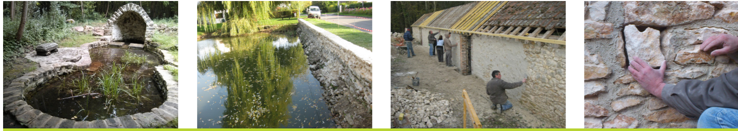
Lavoir, muret, puits, ponceau, intégration de cavités dans le bâti, etc.